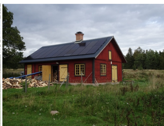
Sunneränga 1:3, Norra Sunneränga 2.