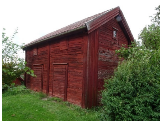
Timrat magasin på Sunneränga Södergård 3:7.

Utmed landsvägen Eksjö-Tranås finns en smedja/verkstadsbyggnad från sekelskiftet 1900. Nästan all bebyggelse inom området är rödfärgad med vita fönsteromfattningar och tegeltak. Till gårdarna hör uppvuxna trädgårdar med stora och gamla frukt- och vårdträd. Odlingslandskapet är präglad av en levande landsbygd med ett aktivt jordbruk. Inslagen av åkerholmar och odlingsrösen är stort på markerna uppe på åsen, medan de mot väster sluttande markerna har dominerats av stordrift inom jordbruket. Sunneränga är ett pedagogiskt och väl valt exempel på en nordsmäländsk by som genom skiftesreformerna under 1800-talet splittrades genom att bebyggelsen flyttades ut på ägorna. Tack vare den bördiga jorden och de goda möjligheterna till att försörja sig på jordbruket, uppfördes i Sunneränga ovanligt stora huvudbyggnader.