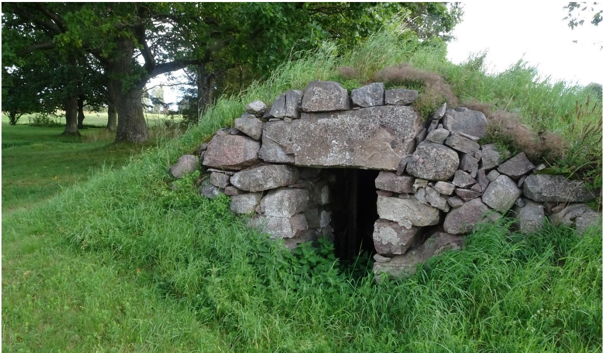
Stensatt jordkällare Sunneränga 2:4.