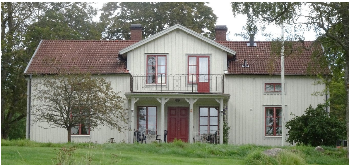
Sunneränga Södergård 3:7.