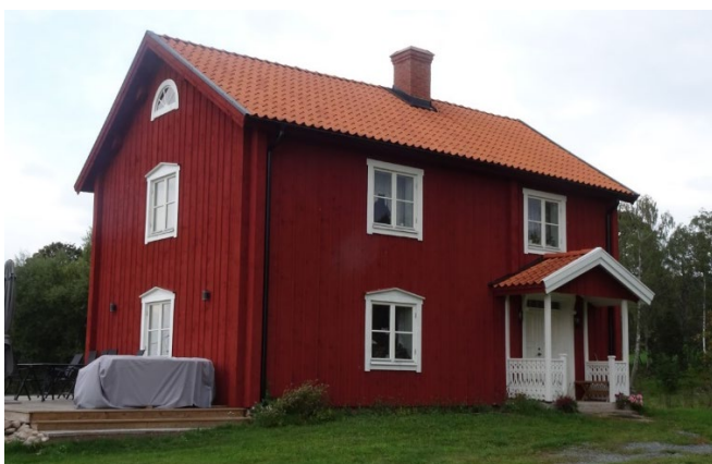
Enkelstugan på Sunneränga 3:3.