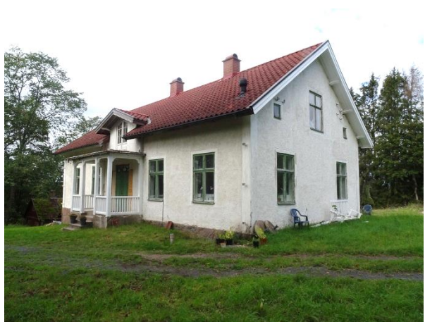
Skolan på Hammarsberg 2:3.