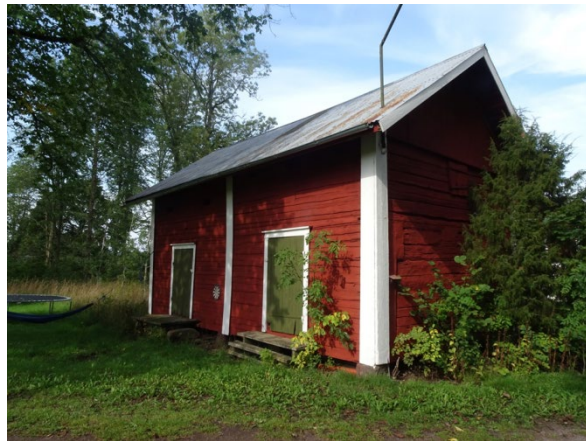
Enkelstuga på Sunneränga Södergård 3:7, samt sädesmagasin Sunneränga 2:5, mycket välbevarat, flyttat till platsen 1857.