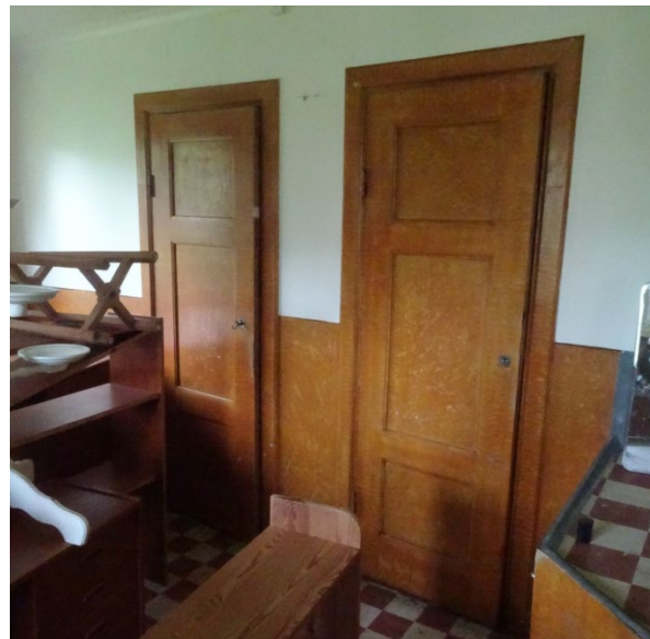
Sunneränga 2:5, Hammarsberg 1.