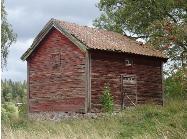
Sunneränga 1:4, Norra Sunneränga 1.

Sunneränga 1:4, Norra Sunneränga 1 med antecknat byggnationsår 1909. Lantbruksenhet med fyra byggnader av olika karaktär och ålder, alla med utsikt från åsen. Det slätputsade bostadshuset med mansardtak sticker ut i området med sin form och färgsättning. Byggnaderna är mycket välbevarade men delvis ansatta av fuktskador. Sunneränga 1:3, Norra Sunneränga 2 har en intakt gårdsmiljö med välbevarad bebyggelse. En utbyggd parstuga, timrad ladugård, verkstadsbyggnad och magasin. Garage med äldre regelverk och en mindre stuga och en påbyggd bod på ladugården. Hammarsberg 2:3 byggdes som skola 1875 och fungerade som skolbyggnad fram till 1945. Mellan 1948-1995 användes byggnaden som missionshus och kom därefter i privat ägo. Byggd på hög naturstensgrund, vitputsad fasad och grönmålade flaggfönster samt betongpannor som takbeläggning. Välbevarad byggnad med ursprungliga fönster och verandadörrar i den mindre frontespisen. Tillhörande uthus i dåligt skick. Sunneränga 2:5, Hammarsberg 1, en välbevarad gårdsmiljö i kuperad terräng med högresta äldre träd. Mangårdsbyggnad i 6-delad plan från omkring 1880 är delvis förändrad, men inga stora ombyggnationer har skett på senare tid. Även många bevarade detaljer i interiören såsom planlösning, trappa, bakugn mm. Delar har bytts ut men inga större renoveringar sedan 1940-talet. Det är även då upprustningen av den äldre statabostaden skedde.